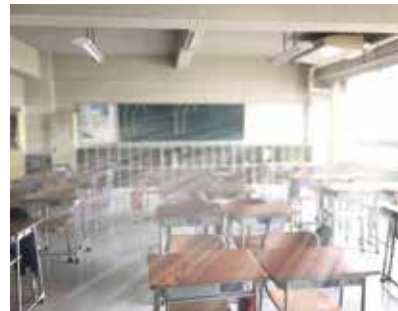
エアコンを設置し、子供の熱中症対策を行います。