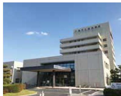
海浜病院老朽化に伴う改修・改築は急務。