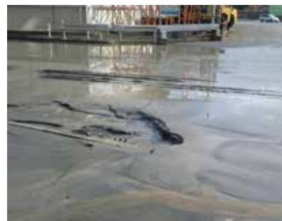
液状化対策にもしっかり力を入れていきます。