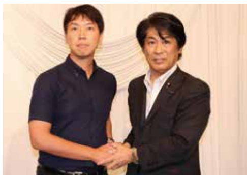
田村 憲久 元厚生労働大臣と